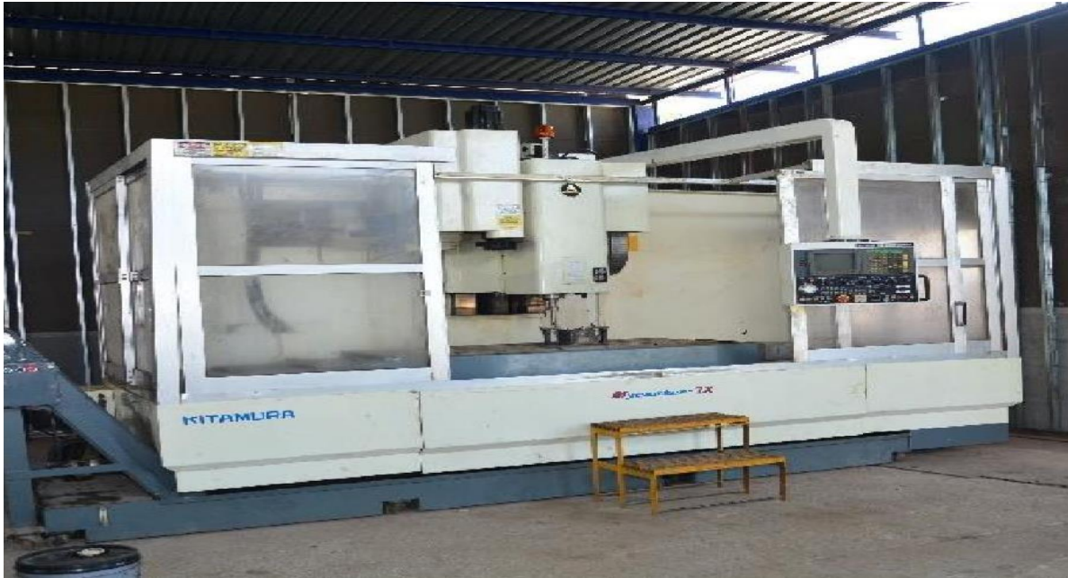
Kitamura CNC Centro de Maquinado Mod X7 Size: X 70", Y 30", Z 30"