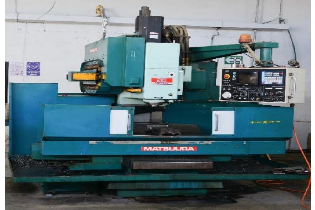
Matsuura CNC Centro de Maquinado Mod 760V Size: X 30", Y 16", Z 19"