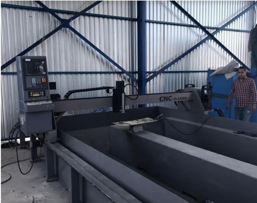
Plasma Hypertherm con Equipo De Oxicorte, Cama 8' x 20'