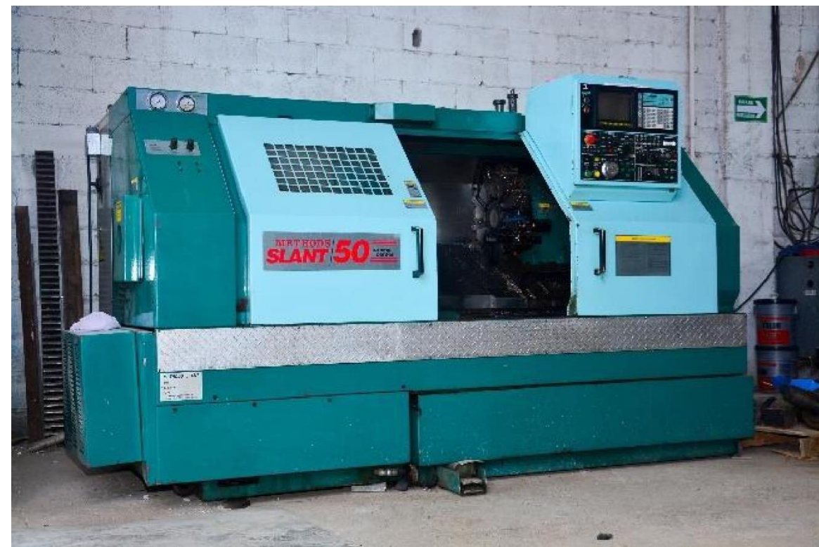
CNC Torno: Methods Slant Bancada 33" & 12" Volteo