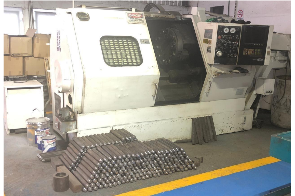
CNC Torno: Hitachi Bancada 33" & 13" Volteo