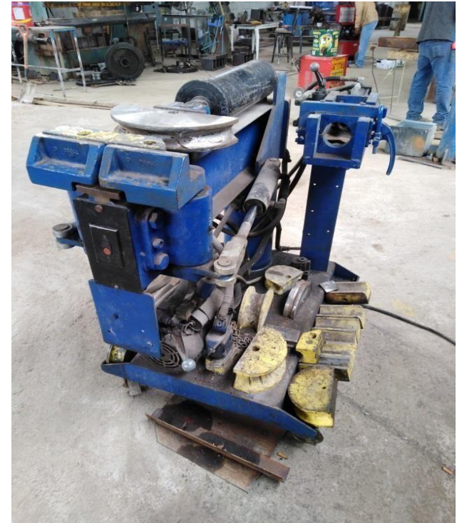
Roladora de Tubo hasta 2-1/2"