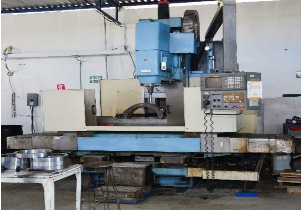
OKK CNC Centro de Maquinado Mod 650V Size: X 60", Y 26", Z 26"